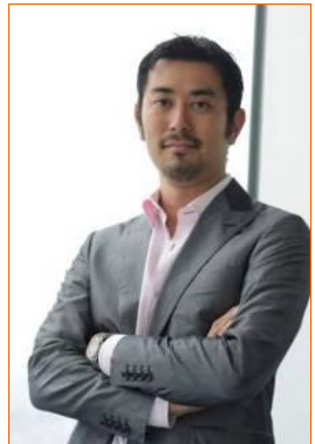
アートアクアリウムプロデューサー

また、環境保全活動も積極的におこなっており、米国フロリダの世界最高レベルの海洋学研究所であるハーバーブランチ海洋学研究所のアクアリウムマテリアルブランド「ORA」を日本に展開させ、アクアリウムと自然環境保護を結びつける活動や、大成功のアートアクアリウムと並行して、2004年から開催している「東京アクアリオ」は東京の中心で行われるアクアリウムを前面に出した海洋保全イベントであり、オーシャンアスリートなどの水に関わる多くの人々や美しい海を保有する国や地域からのサポートを受けた活動である。オーシャンアスリート達と共に取り組む海の自然を考える活動「One Ocean プロジェクト」などを盛んに行っている。